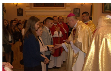
Młodzież ofiaruje dar dla misji